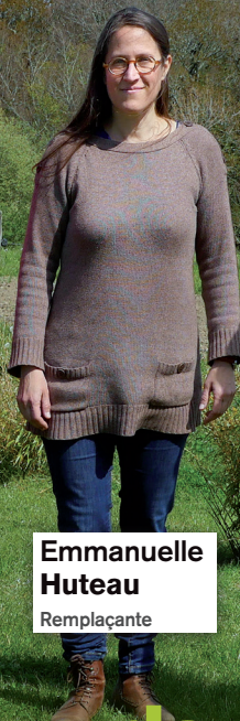
Emmanuelle Huteau Remplaçante